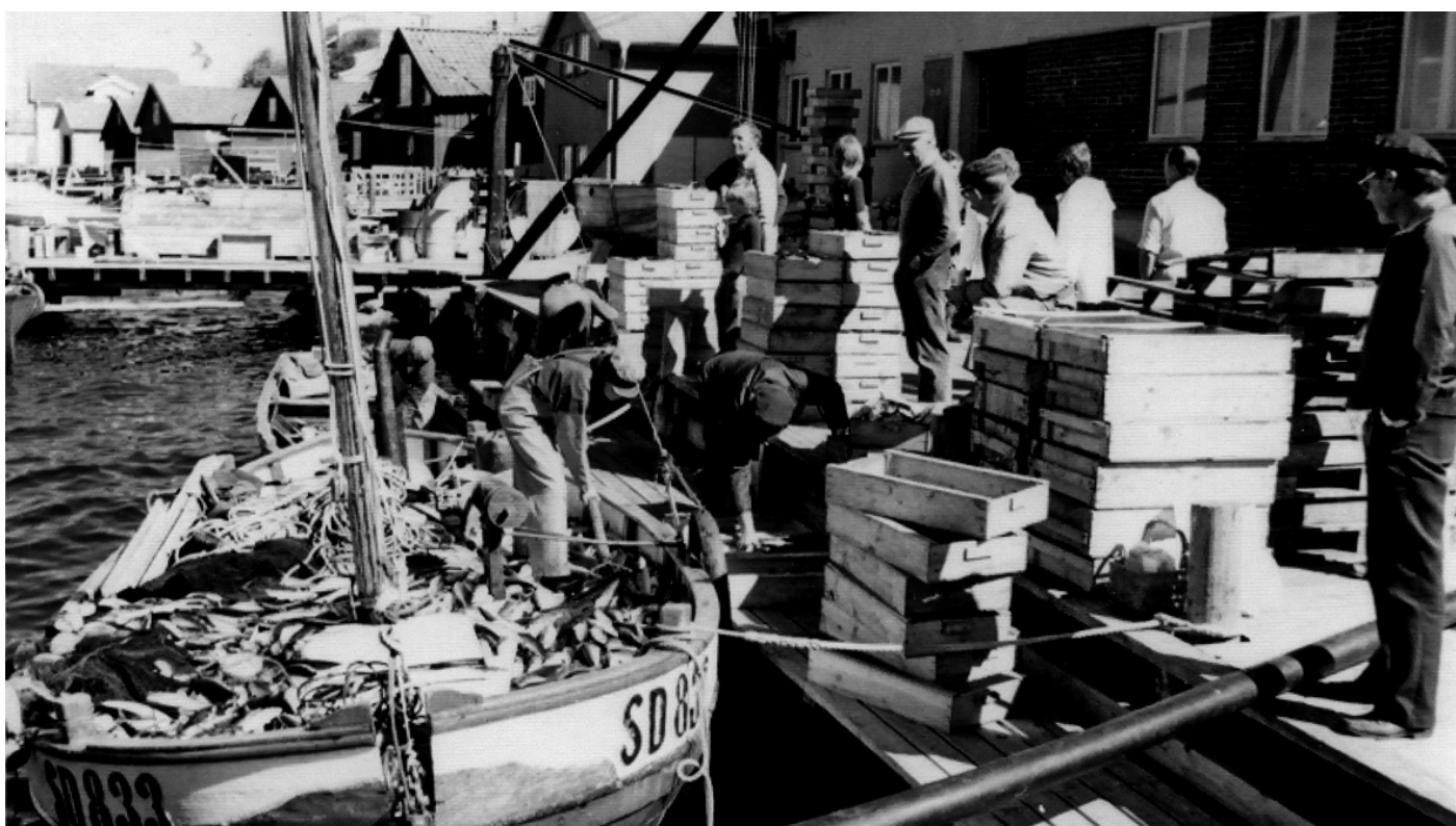
Det enda foto jag har från denna sommar är när vi landar just denna fångst vid fiskebryggan i Fjällbacka.

torkningsprocess undvek man att bomullsduken ruttade på däck under helgen. Det gjorde att man fick en torr snörpvad ombord på måndag morgon – om det inte regnade.